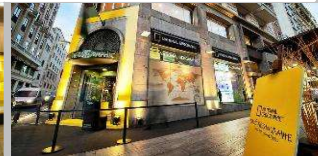
Desarrollo de marca, diversificación de producto y estrategia internacional de expansión