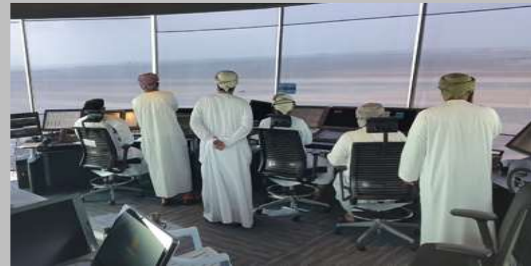
Gestión del tráfico aéreo y de operaciones